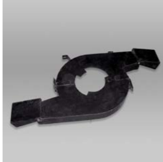
Convogliatore doppio Double Conveyor Doble Transportador