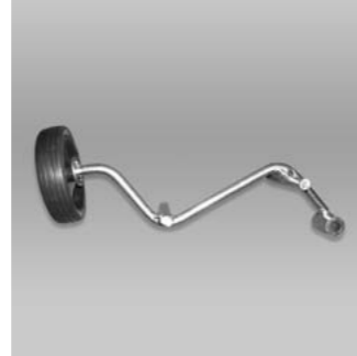
Agitatore articolato Articulated Agitator Agitador Articulado